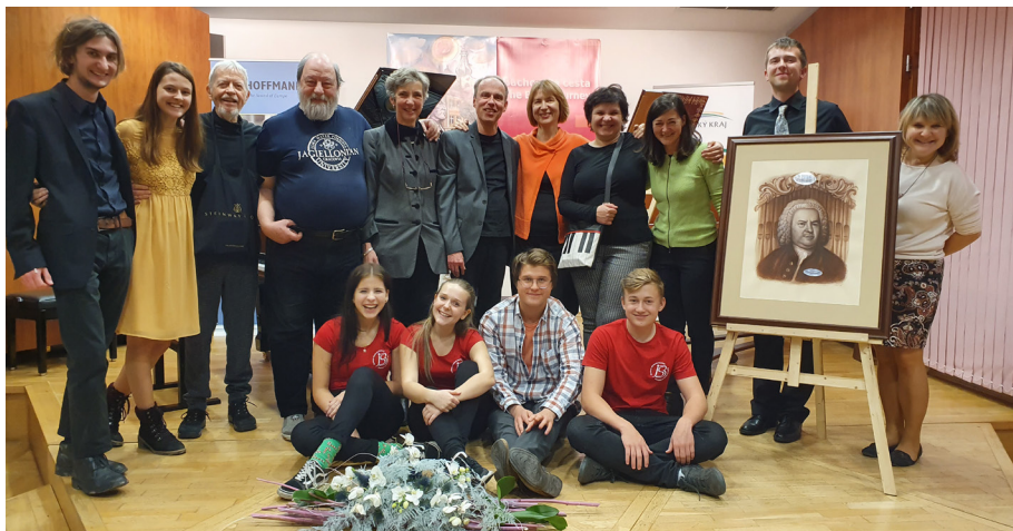
1. ročník mezinárodní soutěže 2019 / 1 st International Bach Competition 2019